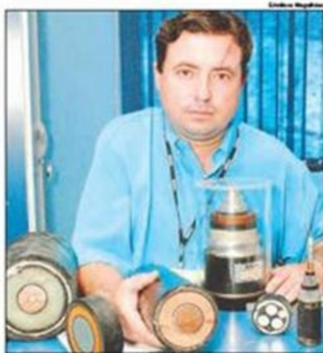
Barboza, da Eng Cabos, espera dobrar produção e vendas

Mesmo com o aumento da demanda devido ao programa Luz para Todos, ainda sobrá capacidade instalada nas empresas nacionais. "As fábricas